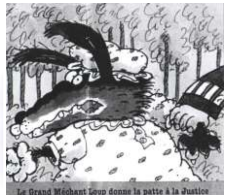
Le Grand Méchant Loup donne la patte à la Justice